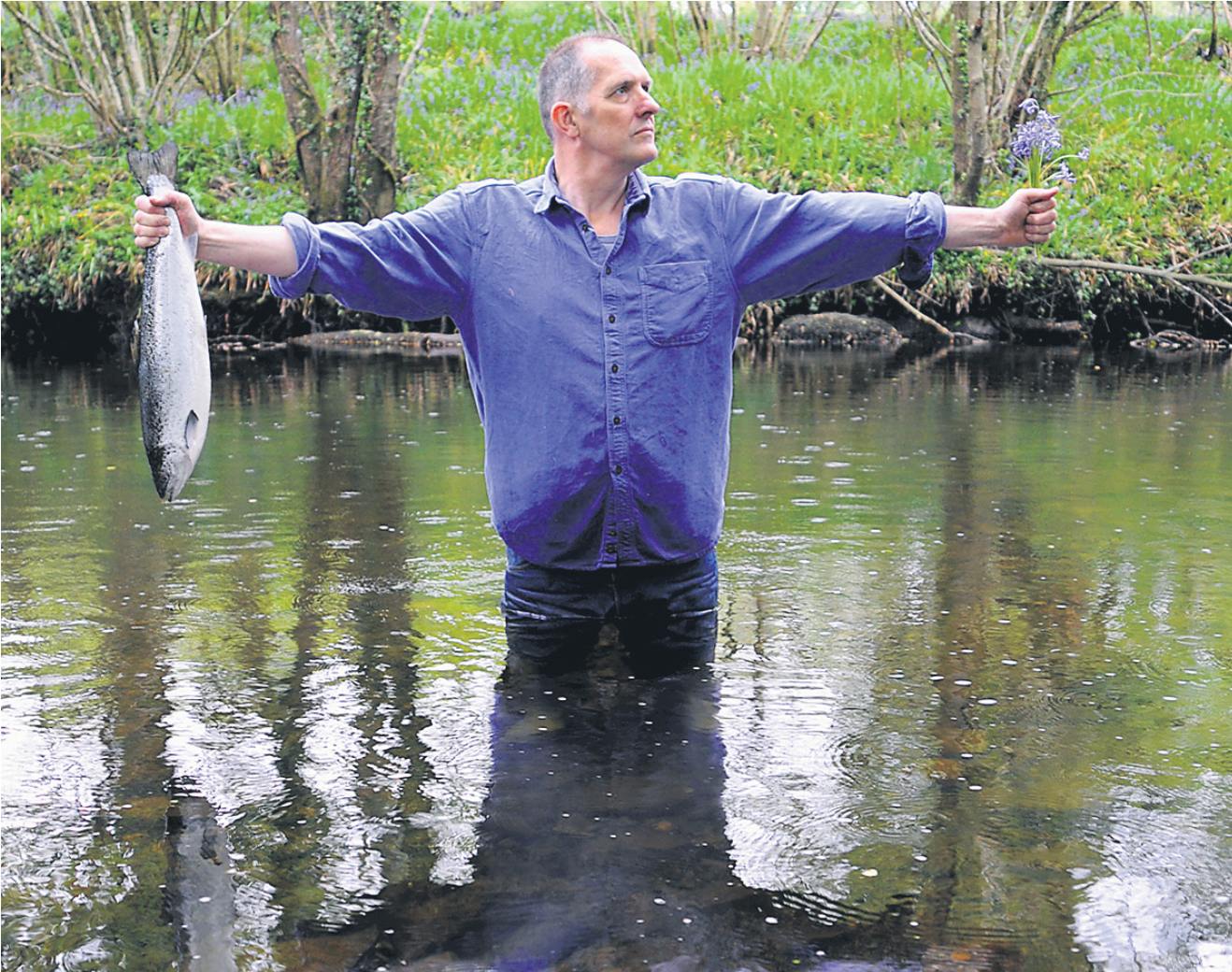
KONTROVERSIELL. Den före detta KLF-medlemmen Bill Drummond väcker känslor. Antingen hyllar man hans konst eller tycker den är exkluderande och elitistisk.