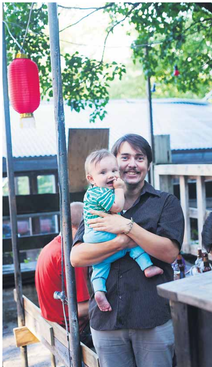
KULTURBYGGARE. Hemliga trädgården öppnar igen. Det kan bli fester som förr, men det är kulturen som är det viktiga. "Det ska vara en öppen plats som formas efter vad de som söker sig hit vill göra",